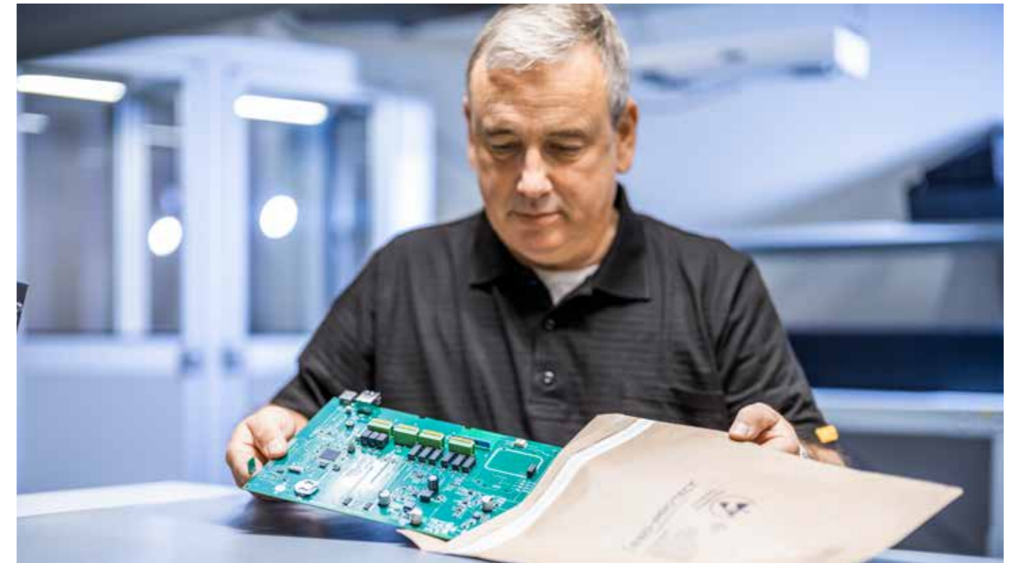
PaperStat® ESD-Verpackungsbeutel aus 100% Recyclingpapier – permanent dissipativ & 100% recyclebar.